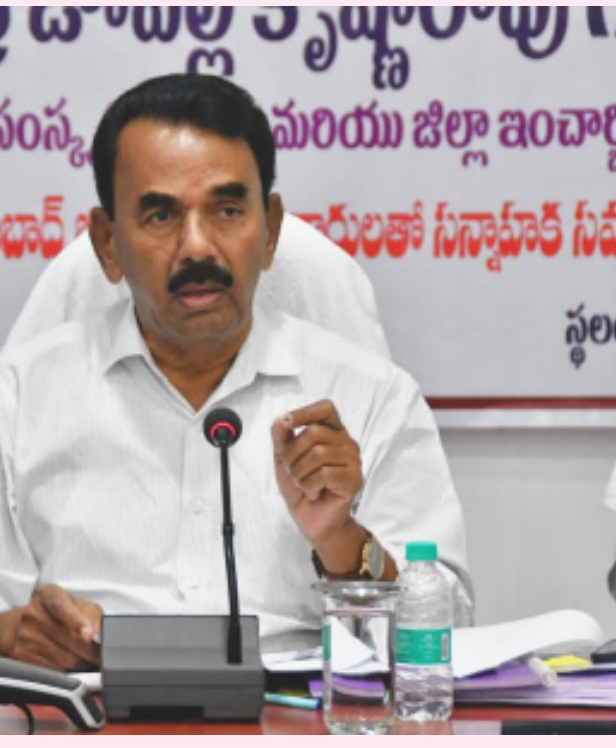
వ్యవస్థ పరిపుష్టమైందని తెలిపారు. జీవితం కష్టసుఖాల సమ్మేళనం, ఉగాది పచ్చడిలోని షడ్రుచుల మాదిరిగానే జీవితంలో ఎదురయ్యే కష్టసుఖాలను సమానంగా స్వీకరిస్తూ ముందుకు సాగాలన్నారు. శ్రీ పరాభవ నామ సంవత్సరంలో తెలంగాణతో పాటు, దేశం మరింత అభివృద్ధి సాధించాలి అని ఆకాంక్షించారు.

వ్యవసాయ సంవత్సరంగా పరిగణించే ఈ ఉగాది రైతులకు, ప్రజలకు అన్ని రంగాల్లో శుభాలను చేకూర్చాలి అని మంత్రి ఆకాంక్షించారు. సమ్మర్షిగా పంటలు పండి, ప్రజల జీవితాల్లో సుఖ సంతోషాలు వెల్లివిరియాలని అభిలాషించారు. ప్రకృతితో మమేకమై, వ్యవసాయ ఉత్పత్తి నందిండాల్లో పరస్పర సహకారం ప్రేమాభిమానాలతో పాల్గొనే సిబ్బంది వర్గాలకు, ఉగాది గొప్ప పండుగ అన్నారు. ప్రజల శ్రామిక సాంస్కృతిక జీవనంలో ఆది పండుగగా ఉగాదికి ప్రత్యేక స్థానం ఉందన్నారు. రైతుల సంక్షేమానికి రాష్ట్ర ప్రభుత్వం చిత్తశుద్ధితో కృషి చేస్తోందని పేర్కొన్నారు. వ్యవసాయ రంగ అభివృద్ధితో అనుబంధ రంగాలు, వృత్తులు బలపడి రాష్ట్రంలో గ్రామీణ ఆర్థిక